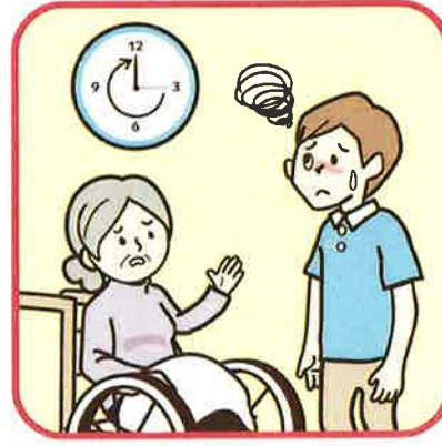
長時間のクレーム