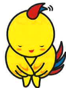
兵庫県マスコットはぼたん

住み慣れた地域で安心して暮らしていただくために、利用者一人ひとりが介護サービスの適切な利用にご協力ください。